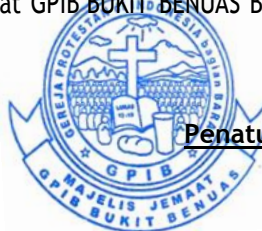
Penatua Netty Kalangi-Sinaulan